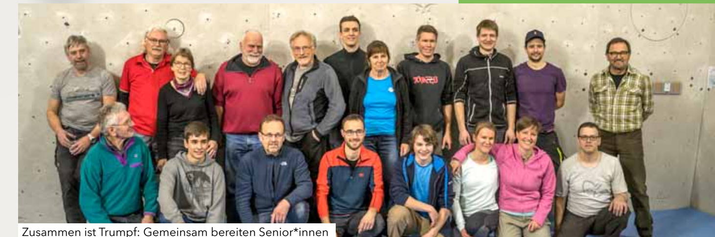
Zusammen ist Trumpf: Gemeinsam bereiten Senior*innen und Jugend die Halle für den BoulderCUP vor

Besonders schön ist es, wenn die Generation gemeinsam aktiv sind, z.B. bei der Vorbereitung von Events oder bei den Kletter-Stadtmeisterschaften.