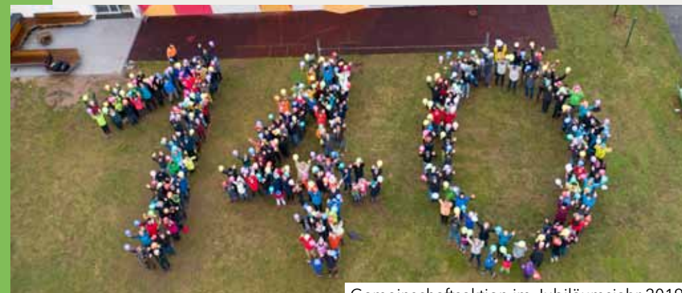
Gemeinschaftsaktion im Jubiläumsjahr 2019

Gesellschaftliches Engagement spielt für uns eine sehr zentrale Rolle: Spezielle Angebote für junge Familien, eine konsequent breitensportlich orientierte Kinder- und Jugendarbeit, enge Kooperation mit den Schulen und der Hochschule und ein immer breiter werdendes Angebot für Menschen mit Behinderung sind einige Beispiele dafür. Wir sind offen für alle.